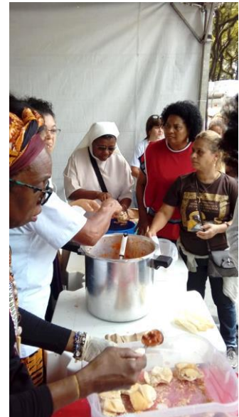
certaines de leurs activités durant cette journée.