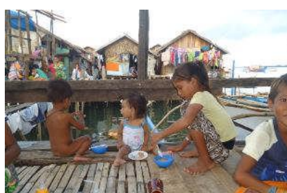
On donne nourriture et suppléments aux enfants mal nourris