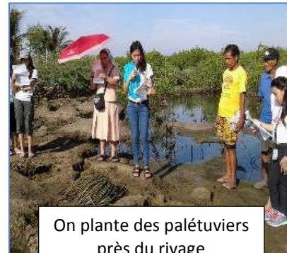
On plante des palétuviers près du rivage