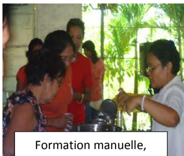
Formation manuelle, fabrication de bougies