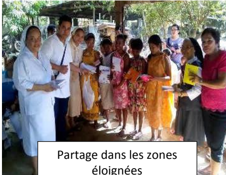
Partage dans les zones éloignées