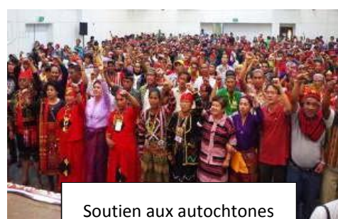
Soutien aux autochtones

Dans tous nos ministères le but est de passer du “je” au “nous”, et de prendre soin ensemble de ce que le Pape François appelle “notre maison commune”! Nous prions :