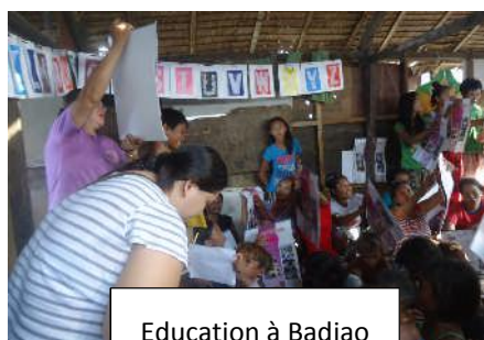
Education à Badjao