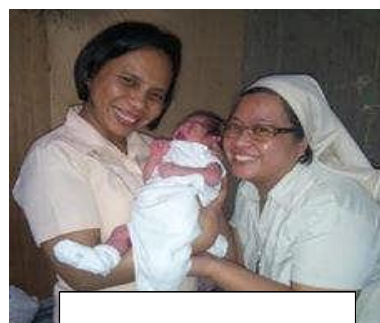
Aide à la naissance