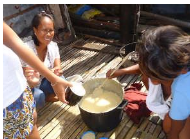
Programme de Nutrition : distribution de repas