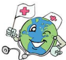
Journée Mondiale de la Santé

7 avril, Journée mondiale de la santé : Depuis 1950, la Journée mondiale de la santé, célébrée chaque année le 7 avril pour marquer l'anniversaire de la création de l'Organisation mondiale de la Santé en 1948, offre une occasion unique de mobiliser l'action autour d'un thème de santé spécifique qui concerne le monde entier.